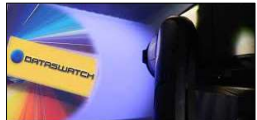
DataSwatch™ - předprogramované barvy