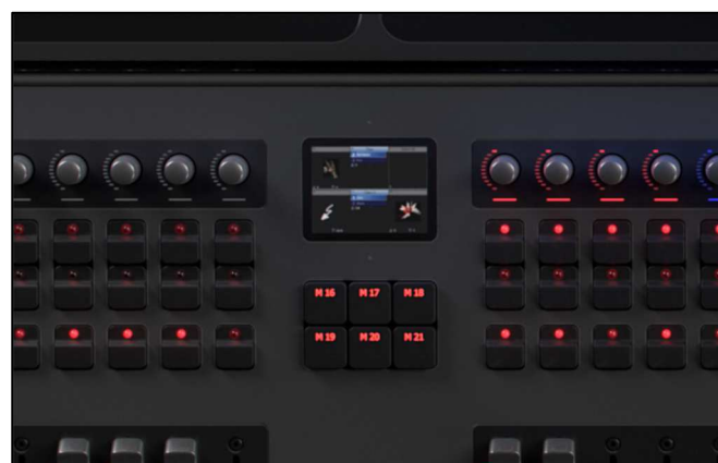
Macro / Executer obrazovka Elektronické popisky nezabírají místo na hlavní obrazovce.