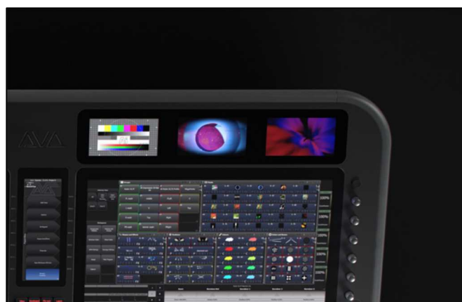
3x 4,3" náhledová obrazovka Náhledy videí přesně tam, kde je potřebujete.