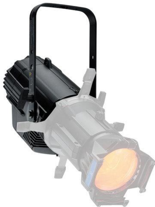
Pro použití s variabilní optikou se objednává pouze tělo svítidla.