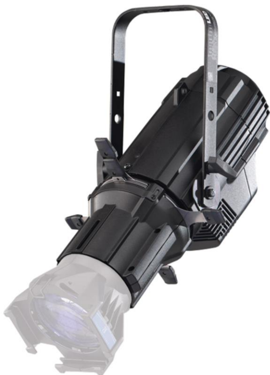
Pro použití s pevnou optikou se objednává tělo svítidla vč. modulu s ořezovými clonami