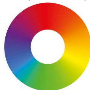
CMY míchání barev