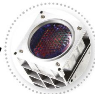
Multi-spektrální LED zdroj