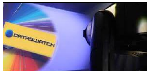
DataSwatch™ - předprogramované barvy